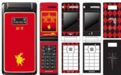
パネル+インナーシート