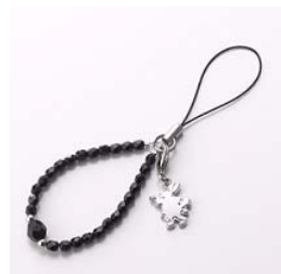
オリジナルストラップ

■ 参考：「fanfun. SoftBank 815T」コラボレーションモデル スペシャルサイト http://mb.softbank.jp/mb/special/815T/fan/